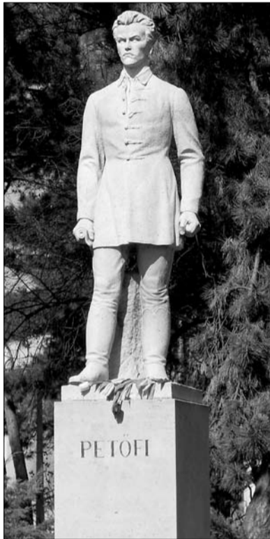
Az egri Petőfi-szobor 2011-ben

1948-ban készítettem ugyancsak a város részére a mártírok emléket, egy 120x75x50 cm méretű öklöt siroki kőből. Ez utóbbi már az új lakásunkban készült, Eger, Neumayer utca 6. szám alatt.