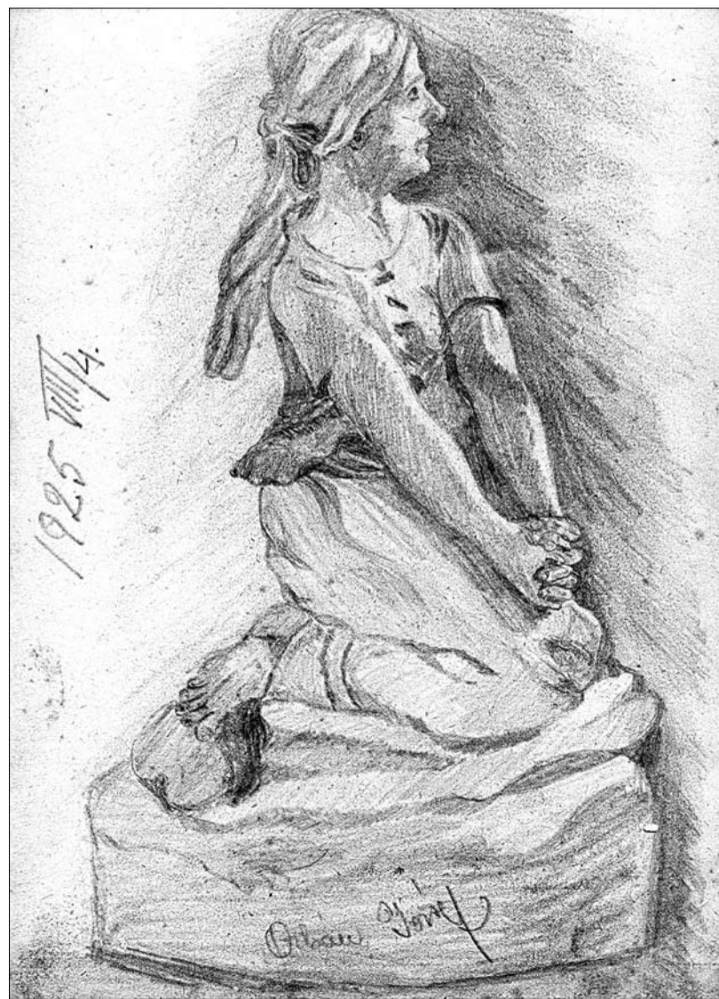
Az első rajzok egyike